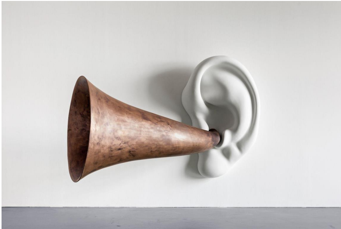
foto: John Baldessari, Beethoven's Trumpet (With Ear) Opus # 133, 2007

Mercoledì 19 aprile 2023, ore 17.00 Palazzo Stocchi, Perugia